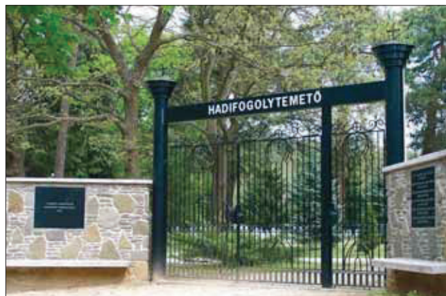
A tábor bejárata

Működése alatt román, orosz, szerb és olasz hadifoglyok tízezeit őrizték, összesen mintegy 140 ezer főt. A ma kb. 800 fős Ostffyasszonyfa egykori barakkvárosa szinte nyomtalanul eltűnt, mementőként csak néhány műtárgy betonalapja látható. Az itt nyugalmat lelt sok ezer halott temetőjében évente ökumenikus szertartással, római és görögkatolikus, protestáns, valamint pravoszláv-ortodox papok, lelkészek közreműködésével – katonai tiszteletadás keretében – emlékeznek az elhunytakra. Itt kell megjegyezni, hogy az egykori tábor temetőjét, az ott nyugodó katonák emlékét a két világháború közötti Horthy-korban lelkiismeretesen ápták, sírjaikat gondozták. 1945 után a lelketlen, tiszteletet, lovagiaságot nem ismerő évtizedek alatt ezt az elvtársak „elfeledték”, és csak 1989 után gondoltak arra – részben a helyi lakosság, részben a Honvédelmi Minisztérium új vezetése –, hogy tiszteletet érdemelnek ezek az elhunytak, mert az alávaló céllal, szándékosan kirobbantott, esztelen háború hősi halottai ők is. Nyughelyük ma ápoltt, emléküket különböző nyelvű obeliszkok őrzik. A nyilvántartások szerint 5601 elhunyt alussza örök álmát a katonai jelvényekkel, szimbólumokkal ellátott kövek alatt, névvel jelölt vagy számozott sí-