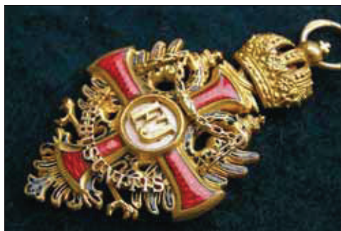
Ferenc József kitüntetése

Kovács Vilmos ezredes levelében magyarázatul, vastag betűvel, külön kiemelte: „A kitüntetések hadi ékitményekkel és kardokkal való adományozása azt jelentette, hogy a kitüntetett személy az ellenség közvetlen tüzének kitéve, életét veszélyeztetve teljesítette szolgálatát. Csatoltan küldöm a kitüntetési javaslatok másolatát, az elismerésre méltott hadicselekmények leírásával. Az I. világháborúban teljesített szolgálata és kapott kitüntetései alapján 1929-ben felvették a