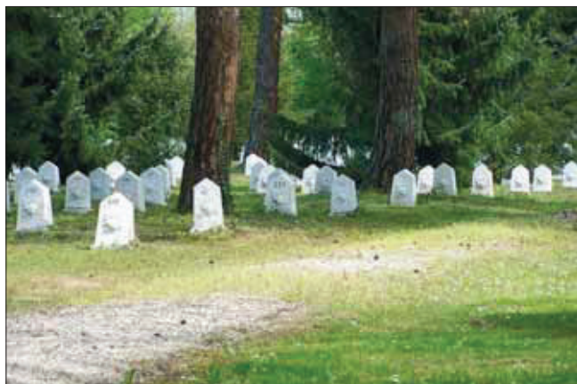
A tábor belseje a sírokkal